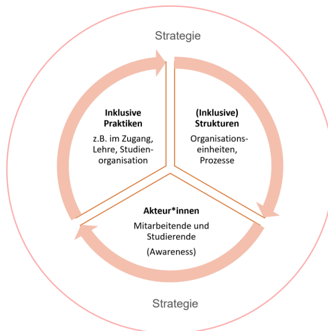
Abbildung 1: Die Verankerung der sozialen Dimension in der Hochschulbildung

Im folgenden Kapitel wird zunächst auf die strategische Verankerung der sozialen Dimension an den Universitäten und Hochschulen eingegangen. Im Weiteren wird thematisiert, wie sich der auf strategischen Rahmenbedingungen basierende Implementierungsprozess innerhochschulisch gestaltet: Welche organisationalen Einheiten sind involviert, wie werden Aufgaben koordiniert und wie erfolgt die Umsetzung von Maßnahmen? Inwieweit gehen letztlich diese Vorgaben in das Handeln der beteiligten Akteur*innen über und entfalten Wirkung?